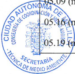
Tabla UNIDADES PRINCIPALES (UP's).

05.01 (m2) DEMOLICIONES PAVIMENTO CALZADA 05.04 (m3) EXC. ZANJA/POZO TERRENO MED. 05.06 (m2) COMPACTACION Y PERFILADO CAJA. 05.07 (m2) PAVIMENTO CARRIL BICI 01.41 (m2) PAVIMENTO CARRIL BICI 05.09 (ml) BORDILLO HORM. PREFABRICADO 05.10 (ml) MARCA VIAL 10 CM. ANCHO 2 CM. 05.19 (ml) PINTURA DOS COMPONENTES