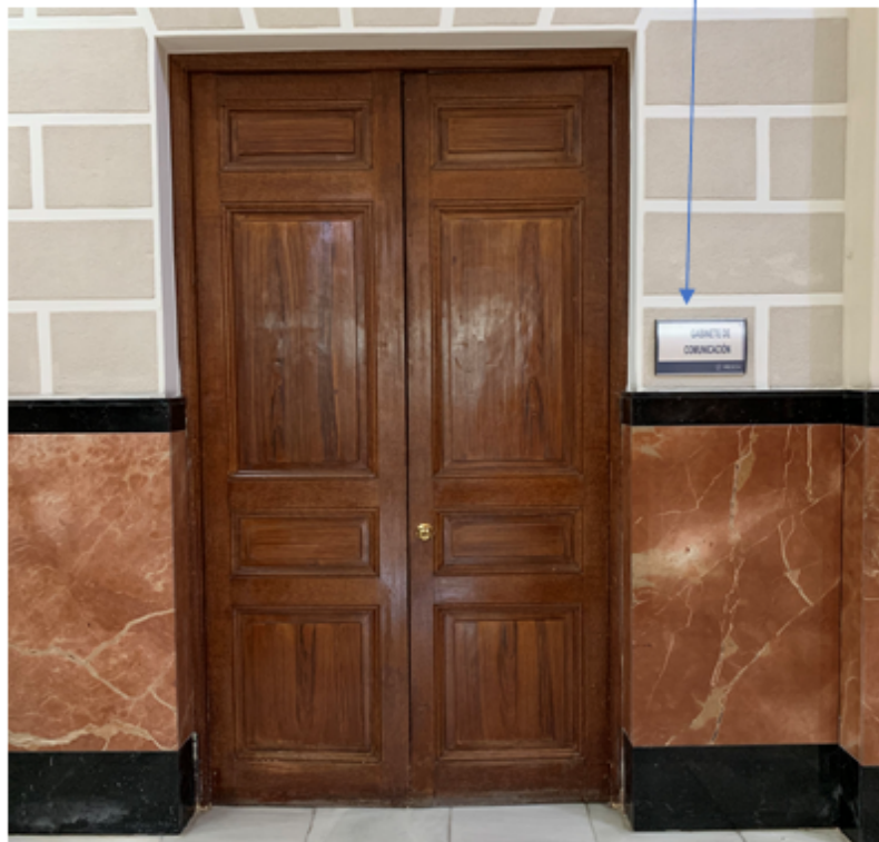
Ilustración 2. Vista frontal de la sede de la nueva Dirección General de Contratación Pública y Subvenciones (DGCP), incluyendo las dependencias a anexar (anterior gabinete de comunicación).

Dependencias colindantes a anexar a la DGCP (anterior gabinete de comunicación)