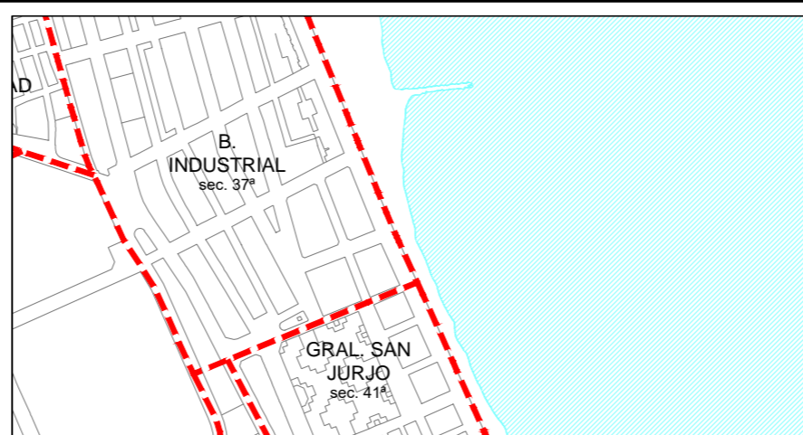
UBICACIÓN BARRIOS SEGÚN HOJA (número de sección s/ Normas Urbanísticas)