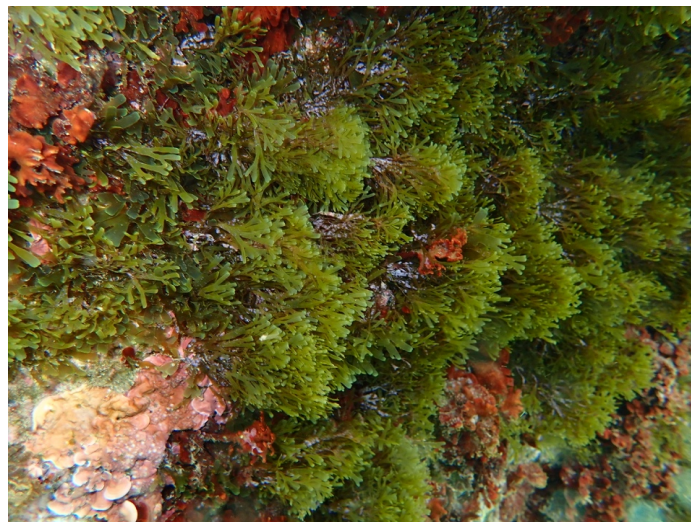
ZEC de Agudú, Melilla, octubre 2024